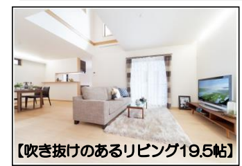
【吹き抜けのあるリビング19.5帖】

【物件概要】●所在地/堺市東区西野●交通/南海高野線北野田駅徒歩12分●土地/112.40㎡●建延/104.33㎡●構造/木造2階建●建築/平成27年5月末日完成予定●消費税含む●外構費用別途●取引態様/仲介